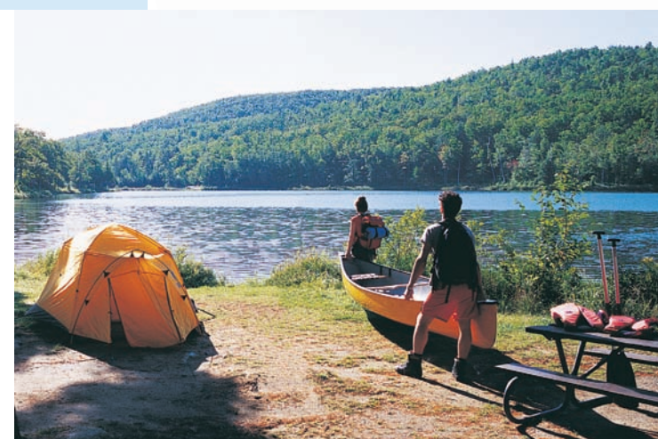
LE LAC TAYLOR • TAYLOR LAKE