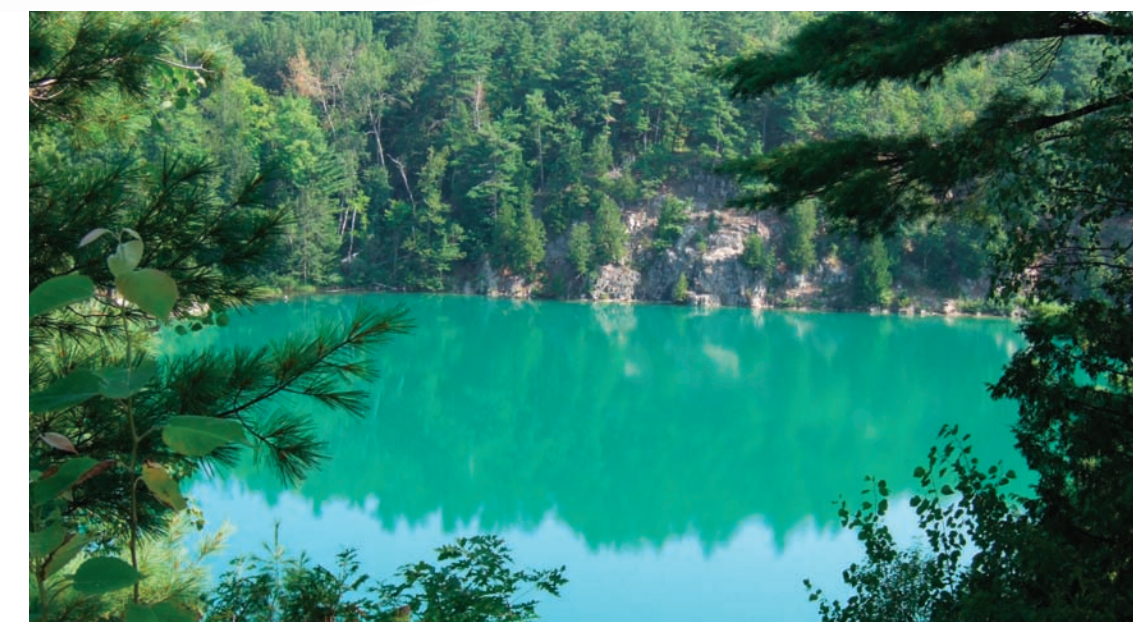
LE LAC PINK • PINK LAKE