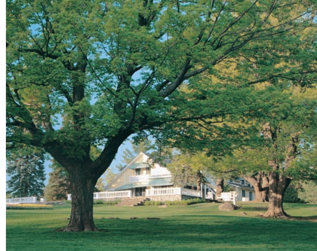
LE DOMAINE MACKENZIE-KING • MACKENZIE KING ESTATE