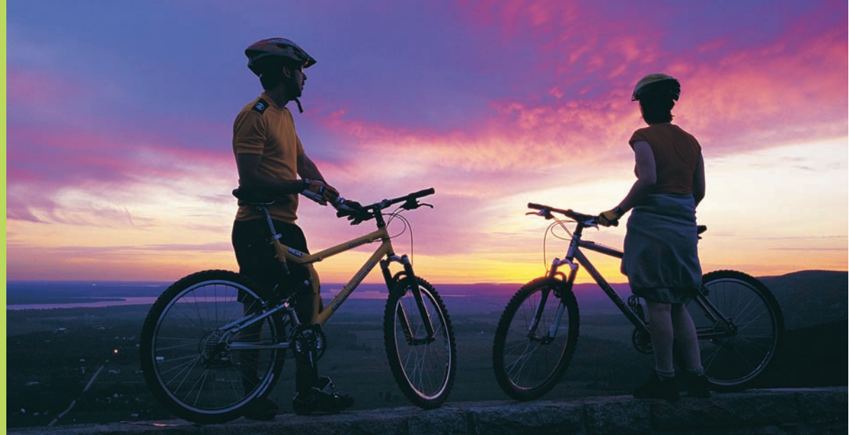
LA VALLÉE DE L'OUTAOUAIS • OTTAWA VALLEY